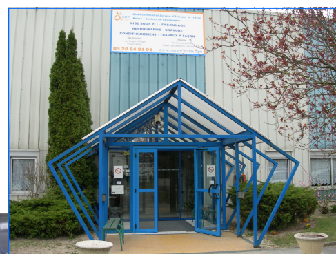
Bâtiment d'origine de l'ESAT Entrée administrative, magasins 4 rue J. Murgier

L'ESAT APF 51 situé aujourd'hui sur l'Actipôle de la Neuville est issu des Ateliers protégés créés en 1954. Son entrée administrative se situe au 4 rue Jacques Murgier mais désormais les usagers accèdent au nouveau bâtiment de production par l'entrée rue Margot.