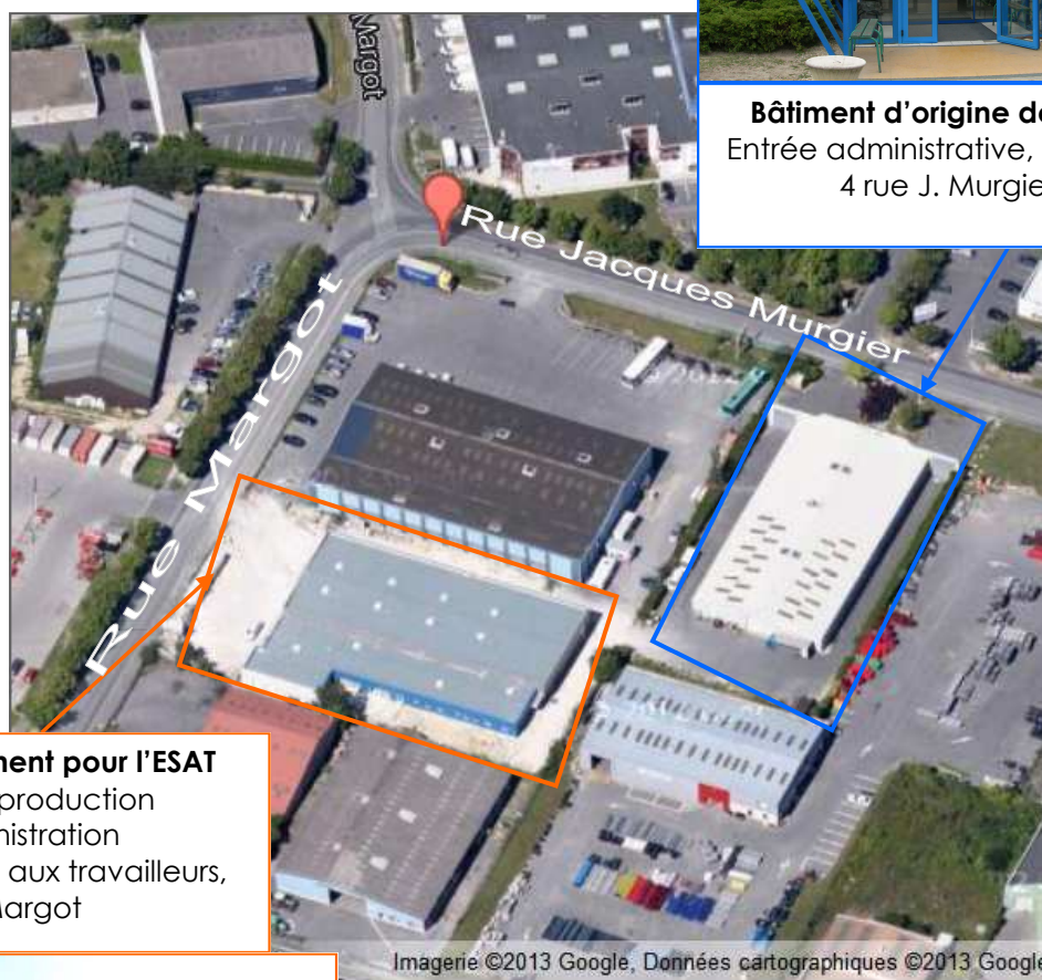
Nouveau Bâtiment pour l'ESAT Atelier de production Et administration Entrée réservée aux travailleurs, rue Margot