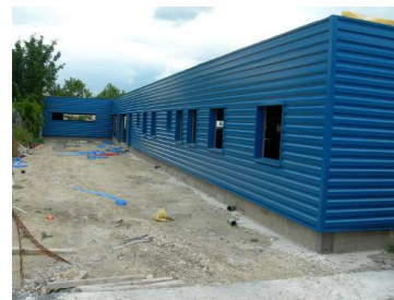
Juillet 2012 ?